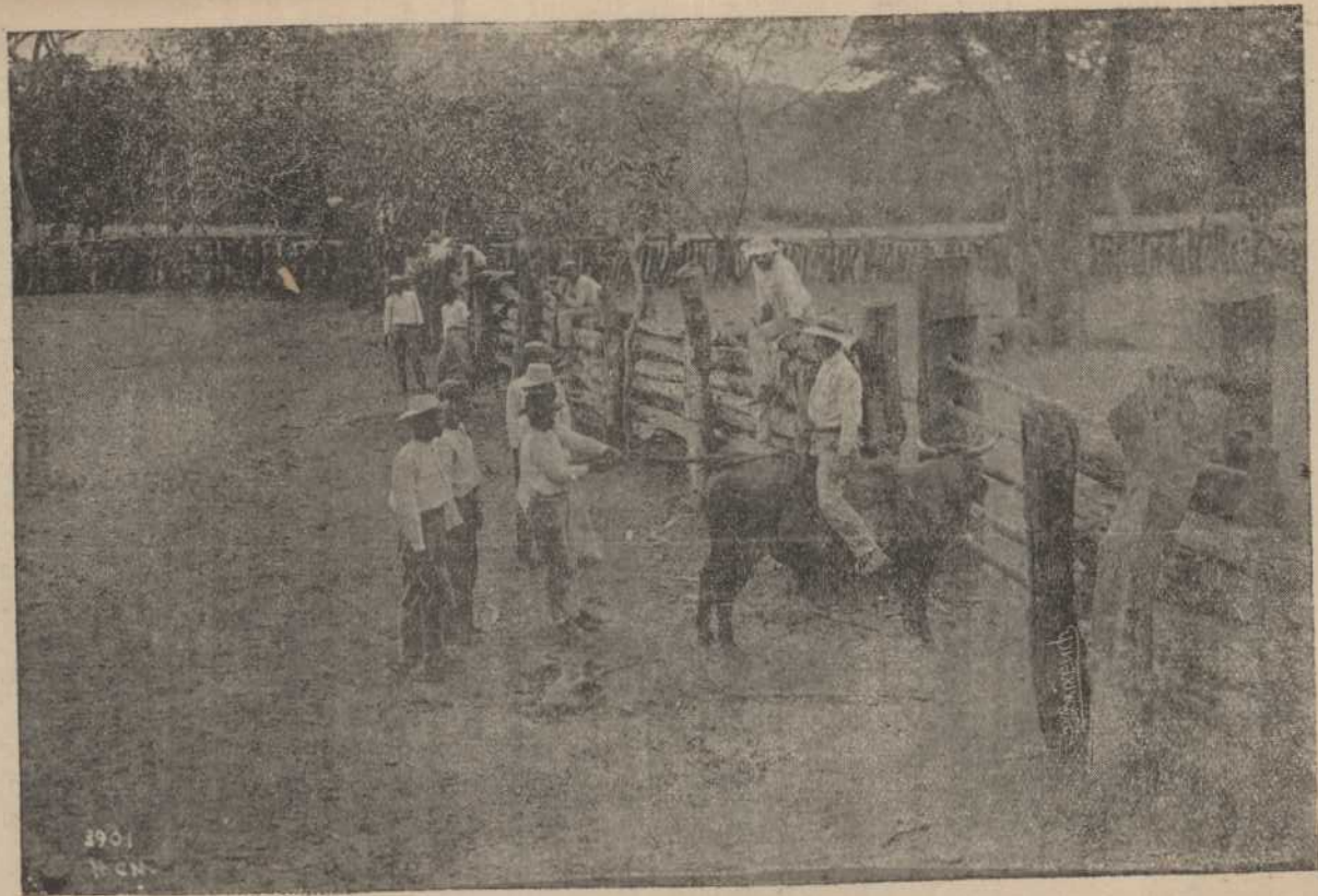
Una corrida de toros en una finca del Guanacaste