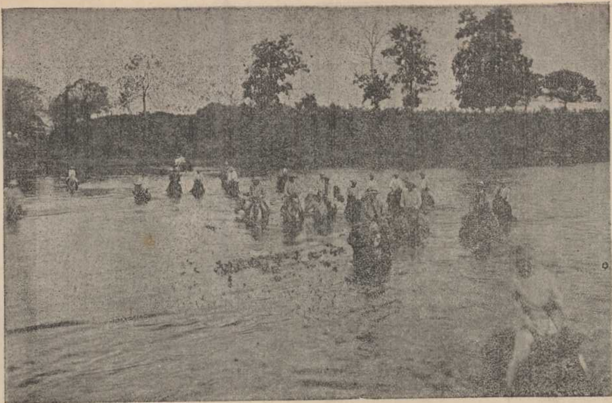
Pasando el río Tempisque